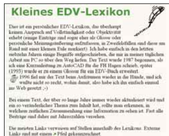
4 Kleines EDV-Lexikon: umfangreiche private Sammlung