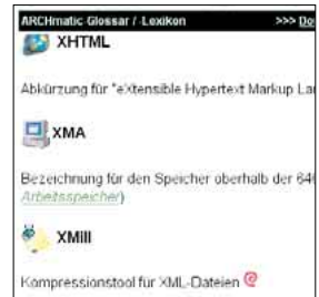
3 Glossar.de: Fachbegriffe für Fortgeschrittene