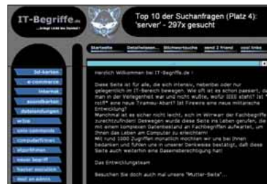
5 IT-Begriffe: viele Wörter, knappe Erklärungen