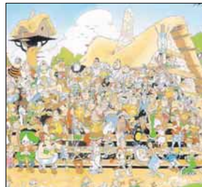
1 Asterix-Lexikon: Jede Comic-Figur wird hier vorgestellt.

BTW: CU L8ER, das war der letzte Webreport im Pctip. IMHO schade, aber dafür gibts an dieser Stelle ASAP noch mehr Tipps, Tricks und hilfreiche Software aus dem Internet. :- ( Nichts verstanden? Das kleine Lexikon der 10 Chat-Akronyme hilft weiter. (bha)