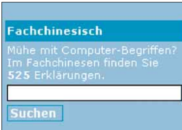
2 Pctip-Fachchinesisch: Die Erklärungen lassen sich auch online abfragen.