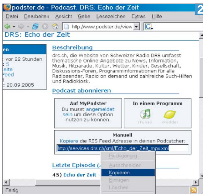
Kopieren Sie den Link des zu abonnierenden Podcasts

fällt: Sind Sie der englischen Sprache mächtig, stöbern Sie im Register PODCAST-VERZEICHNIS, ob für Sie spannende Themen dabei sind. Doppelklicken Sie einen Podcast, der Sie interessiert, kreuzen Sie im erscheinenden Fenster allenfalls noch «Automatically delete episodes more than XX days old» an und klicken Sie auf OK, Screen 1 . Letzteres sorgt fürs automatische Löschen von Podcast-Dateien, die älter sind als die angegebene Anzahl Tage.